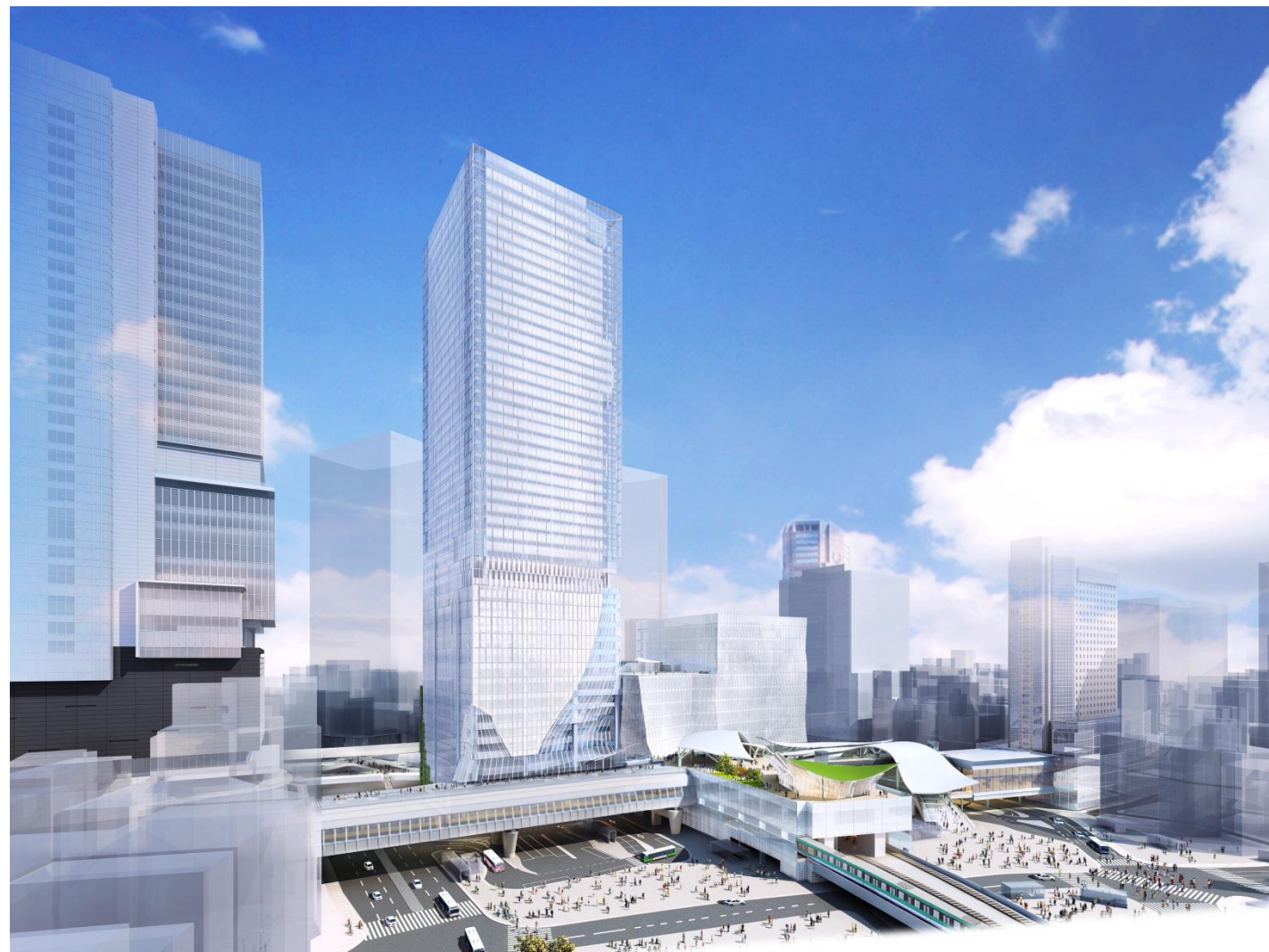
宮益坂交差点方面より望む