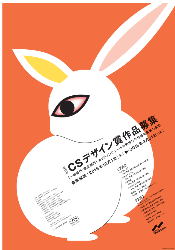
第19回 CSデザイン賞作品募集ポスター デザイン：永井一正

お問い合わせ先 株式会社中川ケミカル 第19回CSデザイン賞係 〒103-0004 東京都中央区東日本橋 2-1-6 岩田屋ビル 3F tel:03-5835-0347 fax:03-5835-0377 mail:info@cs-designaward.jp