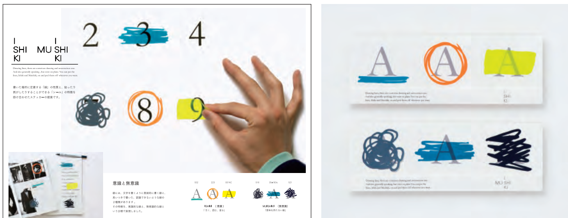
「ISHIKI/MUISHIKI」 三田地 剛志 / 武蔵野美術大学 工芸工業デザイン学科